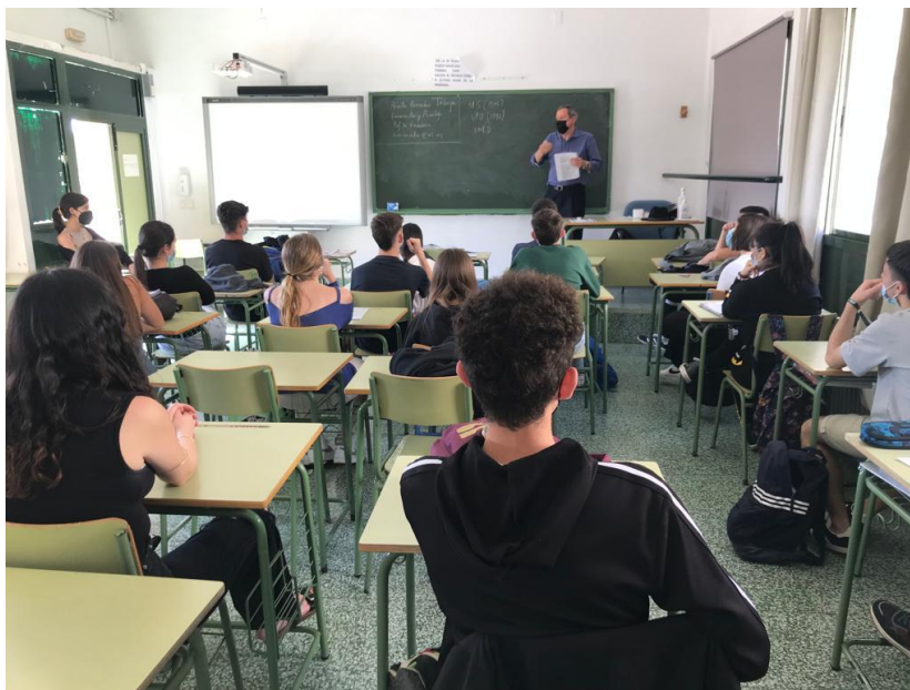
Divulgación de las titulaciones de la Facultad de Turismo y Finanzas: visita a centros de educación secundaria (IES Vicente Aleixandre)