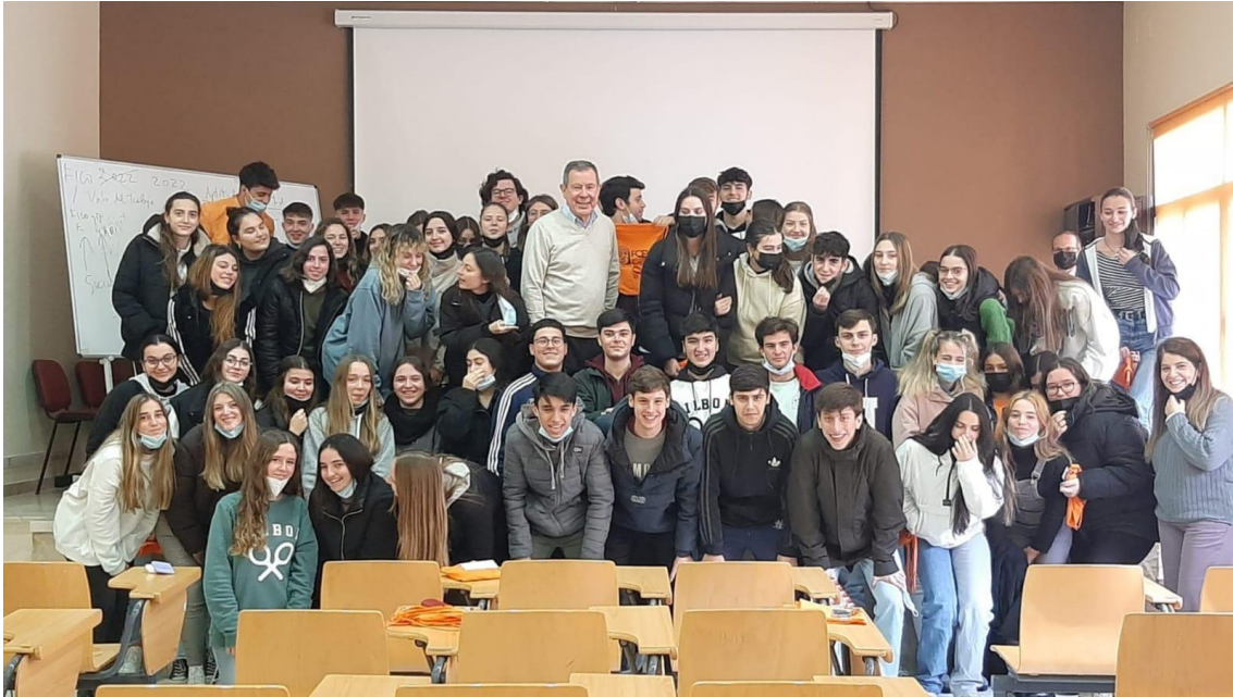
Divulgación de las titulaciones de la Facultad de Turismo y Finanzas: visita a centros de educación secundaria (Salesianos de la Trinidad)