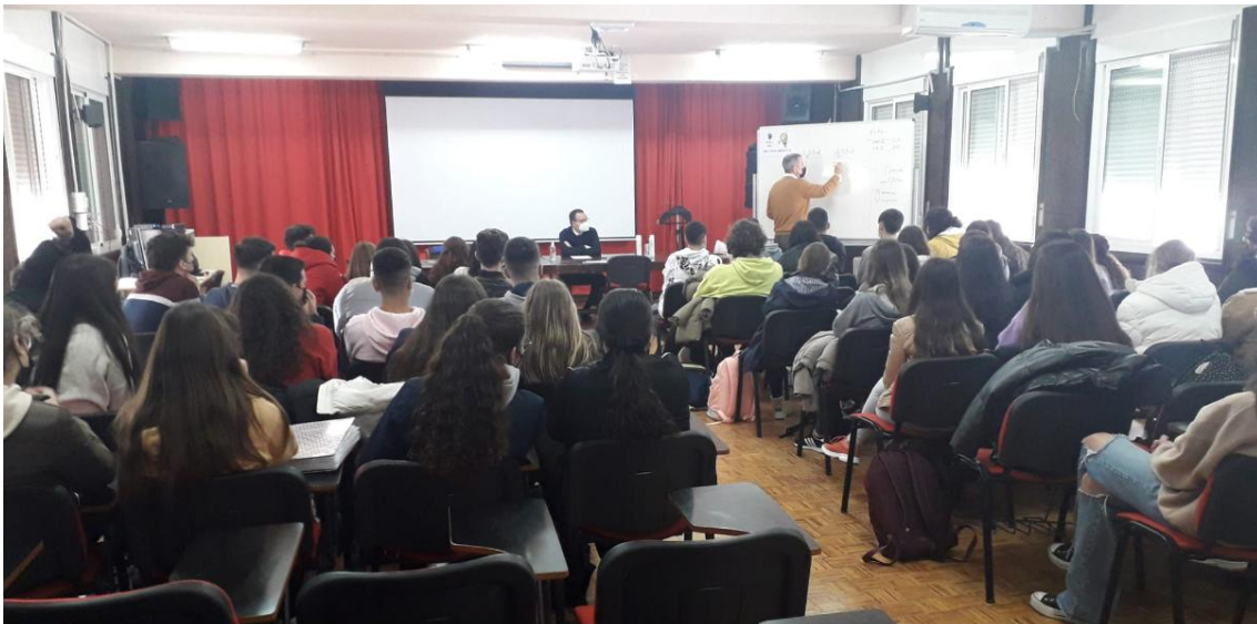
Divulgación de las titulaciones de la Facultad de Turismo y Finanzas: visita a centros de educación secundaria (IES Eugenio Hermoso de Frenejal de la Sierra-Badajoz)