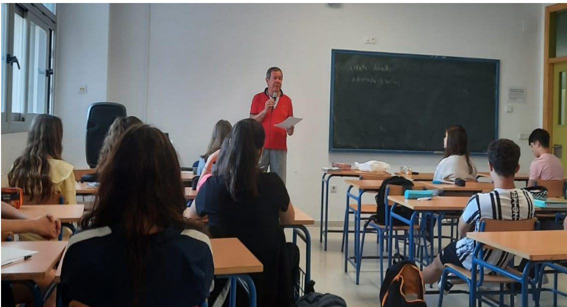
Divulgación de las titulaciones de la Facultad de Turismo y Finanzas: visita a centros de educación secundaria (Cortegana)