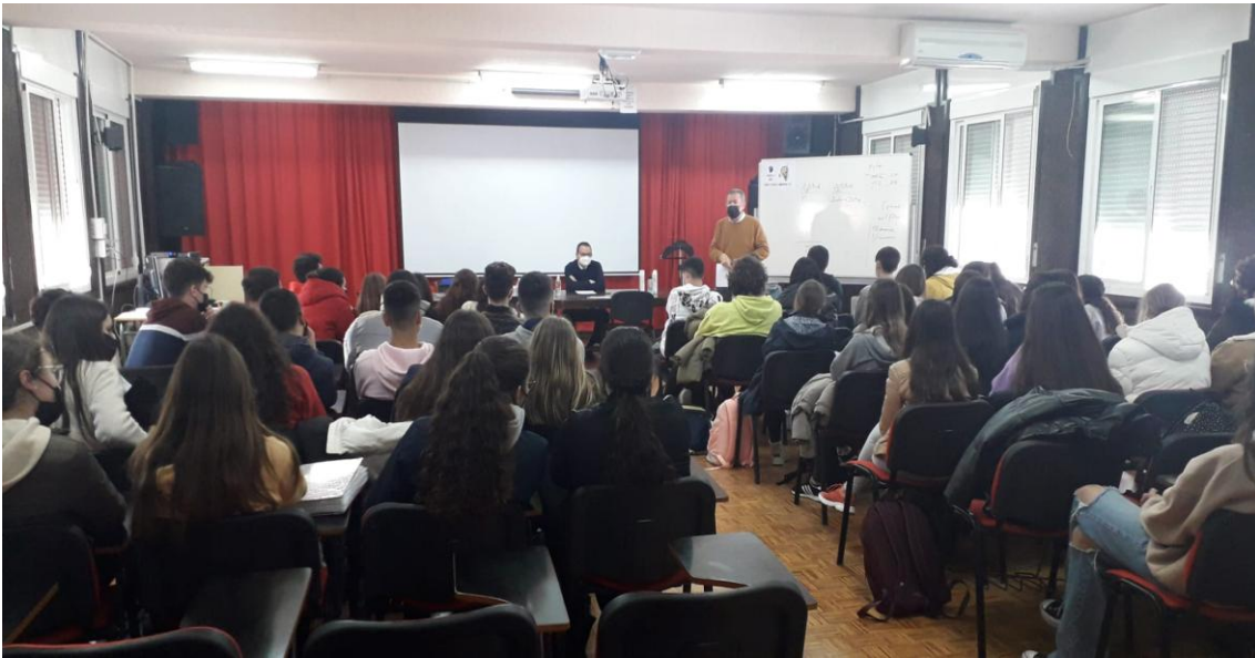
Divulgación de las titulaciones de la Facultad de Turismo y Finanzas: visita a centros de educación secundaria