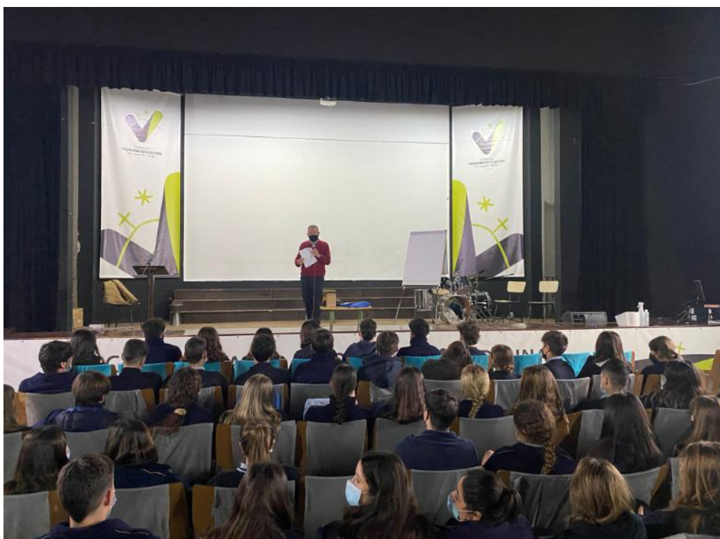
Divulgación de las titulaciones de la Facultad de Turismo y Finanzas: visita a centros de educación secundaria (Colegio Santa Joaquina Vedruna)